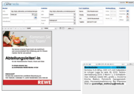
Professionell gestaltete Anzeigen, auch im CI des Unternehmens, lassen sich mit alfa Stylo einfach erstellen.