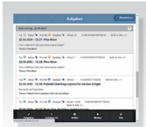
Liste der Aufgaben in Touch

Redaktionen müssen möglichst schnell über die neuesten Ereignisse informiert sein. Reporter sind daher sowohl für die regionale, nationale als auch internationale Berichterstattung unverzichtbar. Deren Nachrichten müssen schnellstmöglich zur Verfügung stehen und verarbeitet werden: die Aufgabe von alfa MediaSuite Touch. Jederzeit und überall mit alfa MediaSuite Touch arbeiten zu können ist für mobile Redakteure und Reporter ein wesentlicher Teil ihrer Aufgabe. Nur so lassen sich Nachrichten effektiv und zeitnah erarbeiten und den Lesern zur Verfügung stellen. In der aktuellen Version des Reportertools von alfa können Profile von Anwendern hinterlegt werden, die es erlauben, Grundeinstellungen zur Verfügung zu stellen. Reporter müssen sich also nicht