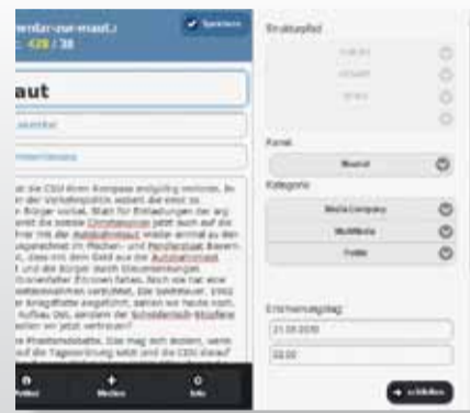
Metadaten zu Medienobjekten