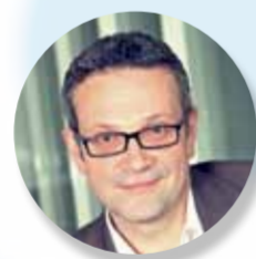
Peter Still Consulting