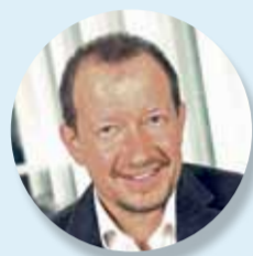
Michael Herget Consulting