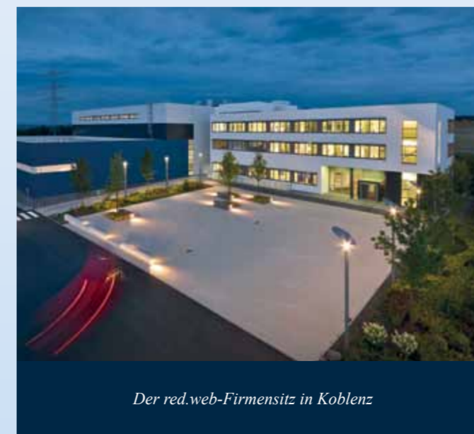
Der red.web-Firmensitz in Koblenz