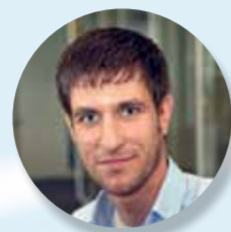
Dominic Rudelle Consulting